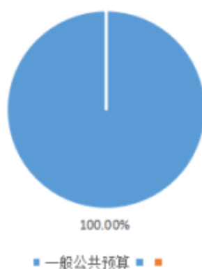
财政拨款支出项目构成情况