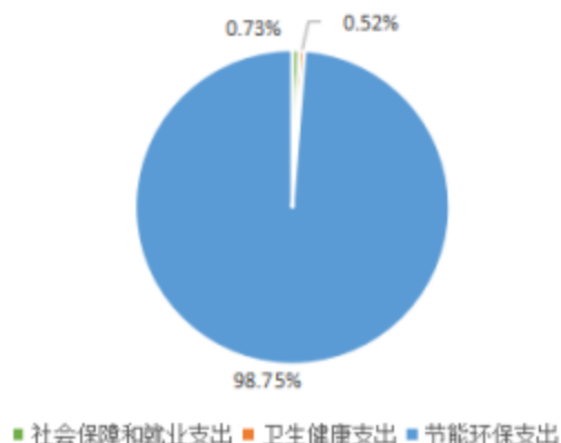
一般公共预算支出类级项目构成情况

烟台市生态环境局招远分局局机关 2022 年一般公共预算支出为 1859.54 万元,其中:社会保障和就业支出 13.61 万元,占 0.73%;卫生健康支出 9.61 万元,占 0.52%;节能环保支出 1836.32 万元,占 98.75%。